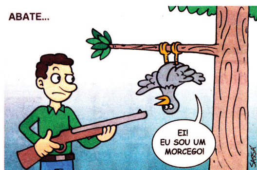
(SASSÁ. Jornal de Londrina , Londrina, 23 jul. 2010. p. 2.)

(MONTEIRO LOBATO, José Bento. Fábulas . 45. ed. São Paulo: Brasiliense, 1993. p. 49.)